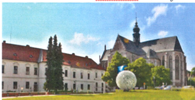
Spaziergang durch Brünn